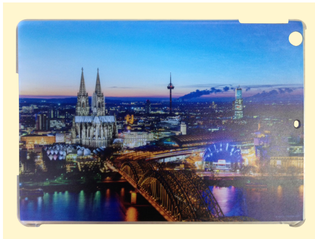
iPad 5 Air

Wichtige Texte und Bilder sollten Sie mindestens 3 mm vom Endformat entfernt anlegen.