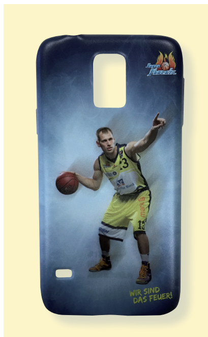
Samsung Galaxy S5

Wichtige Texte und Bilder sollten Sie mindestens 3 mm vom Endformat entfernt anlegen.