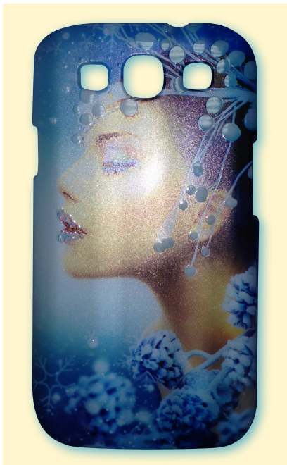
Samsung Galaxy S3

Wichtige Texte und Bilder sollten Sie mindestens 3 mm vom Endformat entfernt anlegen.